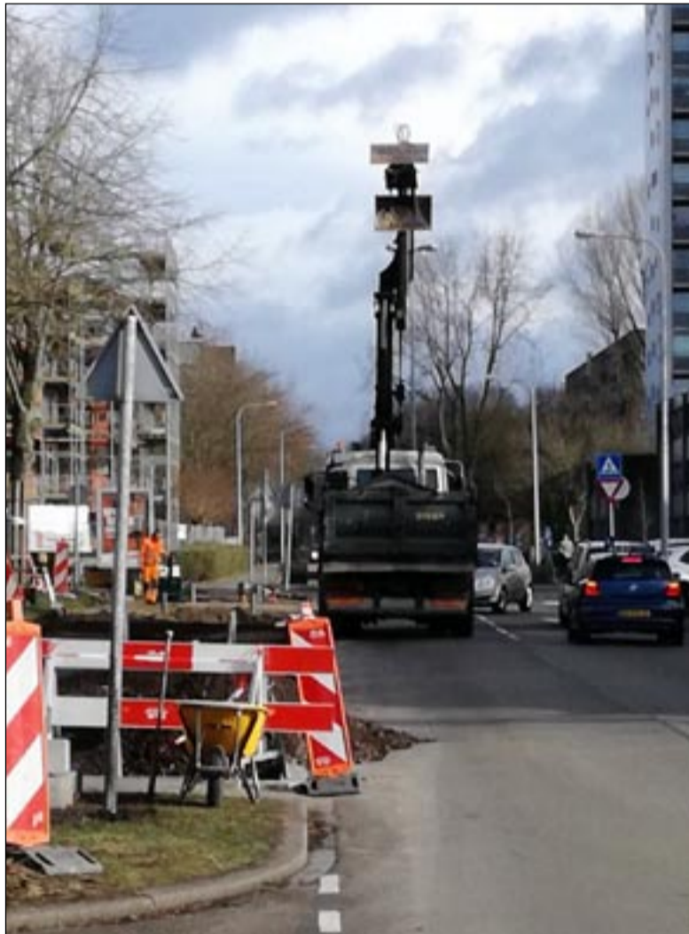
Volop bezig aan de Palmelaan