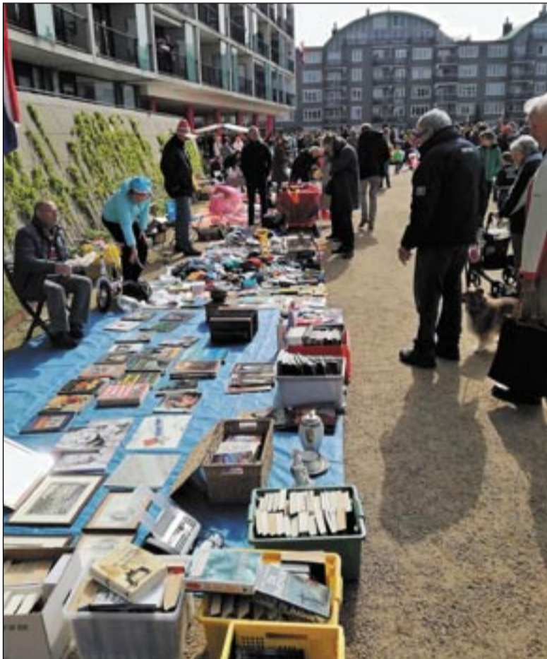
De vrijmarkt op Koningsdag 2018.

Kinderen die muziek willen maken zijn van harte welkom. Dat voegt iets feestelijks toe aan deze mooie dag.