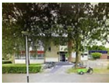
BSO de Blokhut de Wijert

Aan de Semmelweisstraat komen we op de benedenverdieping van de Boerhaaveschool. We werken al jaren intensief samen met deze school en vinden het dan ook erg leuk om naast samenwerken nu ook samen te gaan wonen. In de Wijert krijgen we een gebouw voor onszelf, aan de Multatuli-straat 169. Twee heel verschillende plekken en heel diverse gebouwen, maar allebei zeer geschikt om de BSO in al z'n facetten te herbergen. Op beide plekken komt het volledige aanbod van de Blokhut, dus elke dag alle BSO diensten en elke dag het volledige aanbod aan activiteiten en ateliers. Bent u nieuwsgierig? U kunt altijd bellen voor een vrijblijvende rondleiding of wachten op onze open dagen.