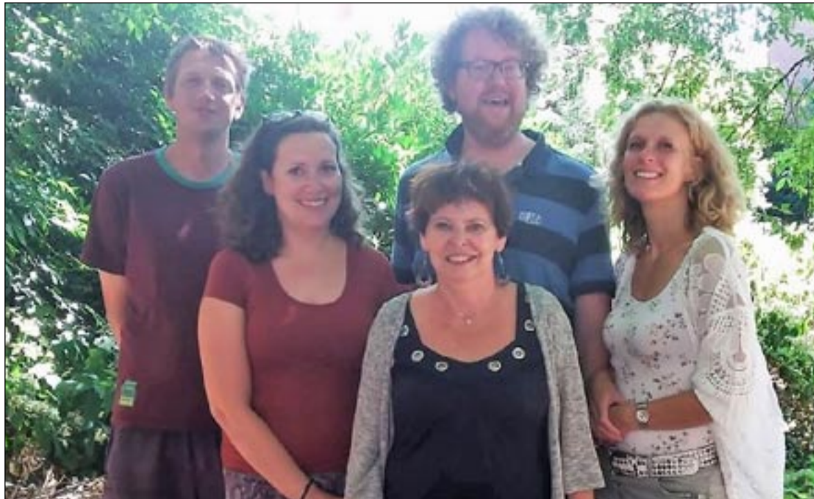
Vrijwilligers van WeHelpen