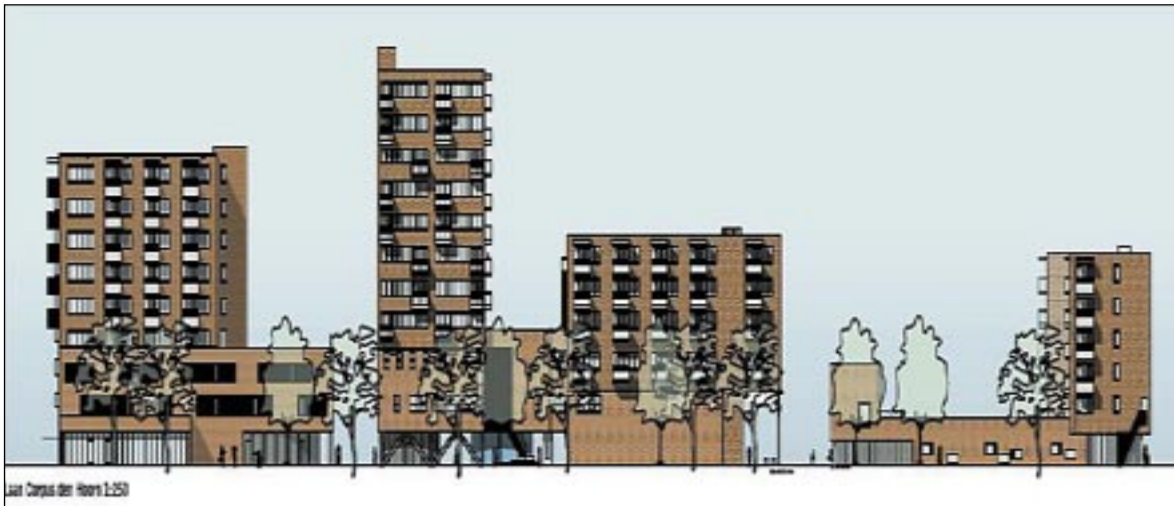
Impressie van het nog te bouwen complex, gezien vanaf de Laan Corpus den Hoorn; rechts de geplande nieuwbouw, links daarvan de bestaande bouw; Ontwerp: DAAD Architecten.

www.corpusdenhoorn.nl/zuidwester of www.meerhoornsemeer.nl