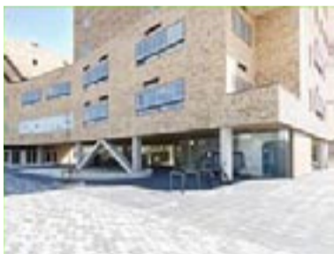
BSO de Blokhut de Semmel

Het was geen gemakkelijk proces, maar uiteindelijk is het toch gelukt met de zoektocht naar een nieuwe locatie. Als snel was duidelijk, dat een plek met net zoveel vierkante meters binnen en buiten als we nu hebben in de oude ALO niet te vinden is in deze omgeving. Vandaar dat besloten is om te focussen op opsplitsing in 2 vestigingen. Voordeel daarvan is ook, dat we dichterbij de scholen kunnen zitten waar we kinderen vandaan halen. Dat maakt het logistiek een stuk makkelijker. We hebben 2 nieuwe plekken gevonden die aan al onze eisen voldoen: voldoende ruimte binnen, meerdere ruimtes, voldoende buitenruimte, dichtbij een gymzaal of sporthal en dichtbij de scholen. Met ingang van het volgend schooljaar gaan we starten met 2 nieuwe locaties: