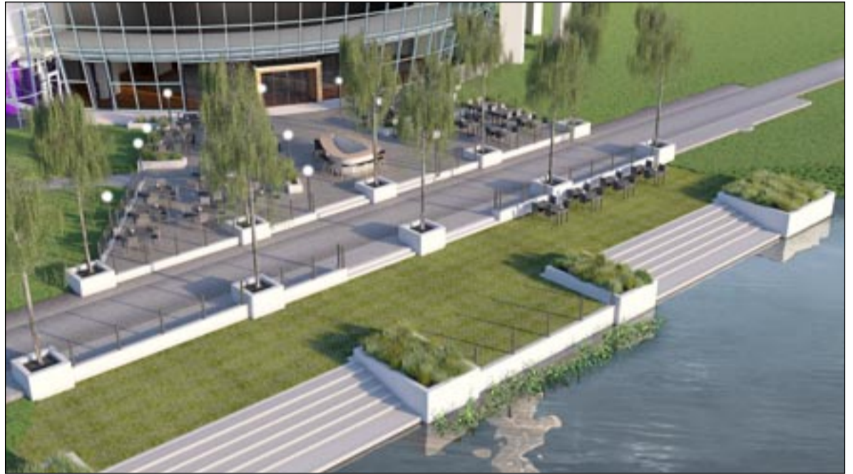
Hoe het terras bij Hotel Groningen Plaza er uit zal gaan zien.

Het voormalig Hampshire Hotel was geen plek waar wijkbewoners en anderen gemakkelijk heen gingen om zich 'te verpozen'. Dat gaat nu anders worden met de uitbreiding van het Hoornsemeer. Er komt niet alleen een nieuw terras, maar ook de ingang naar het restaurant van het hotel wordt aangepakt. Het restaurant zelf zal ook veranderen. Vlakbij het terras kunnen bootjes aanleggen en bij het hotel zullen er waterfietsen en roeiboten zijn voor gebruik door de gasten van het hotel en te huur voor wie er gebruik van wil maken. Het beweegparcours waarover we in vorige edities al berichtten zal vlak bij het hotel worden gerealiseerd. Door onder andere het plaatsen van nestkasten en de aanleg van een oeverwaluwand wordt geprobeerd de directe omgeving van het hotel ook voor vogels levendig en aantrekkelijk te houden. Nieuwe bomen worden geplant en een nectarweide wordt aangelegd.