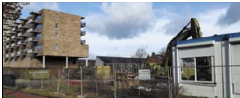
Laatste sloopwerkzaamheden aan de Semmelweisstraat

Als alles volgens planning verloopt start Nijestee voor de zomer van 2019 met de bouw van 30 nieuwe woningen aan de Semmelweisstraat. Er komen 25 appartementen en 5 eenzinswoningen. Alle