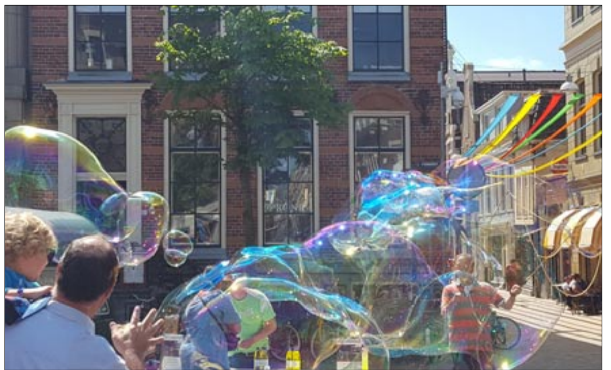
Bellenblazers: foto Chris Fictoor