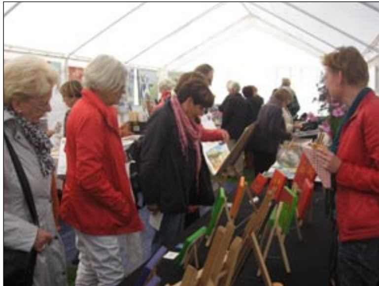
Impressie van een eerdere kunstmarkt

Als organisatoren van de kunstmarkt zijn we er enthousiast over deze te mogen houden op het terrein rond het Wall House. Het wordt vast een prachtige nazomer, maar voor de zekerheid huren we een aantal tenten om de kunstenaars en hun kunst een droog onderdak te bieden. We streven naar een diversiteit aan kunst, die te zien en te kopen zal zijn. Er is livemuziek en natuurlijk is er een hapje en een drankje te 'nuttigen'.