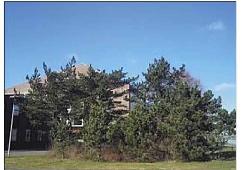
Een groen rustpunt in de wijk