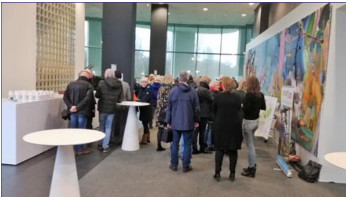
Veel belangstelling op de informatiebijeenkomst

De realisering van het plan van de uitbreiding van de Noordoosthoek van het Hoornsemeer zal de komende maanden voor behoorlijk wat overlast zorgen voor bezoekers van het gebied. Dat kan niet anders. Er wordt echter op alle mogelijke manieren naar gestreefd die overlast zo beperkt mogelijk te houden en de toegankelijkheid van het gebied te waarborgen. Zo blijven de nu bestaande fiets- en wandelpaden te gebruiken totdat het nieuwe wandel-/fietspad klaar is. Ook het terras en het restaurant van het hotel blijven tijdens de uitvoering van de werkzaamheden steeds bereikbaar. Het is de bedoeling, dat het terras al deze zomer in gebruik zal worden genomen. Voor vragen over de uitvoering kunt u terecht bij de projectleider via janlegters@legters-partners.nl