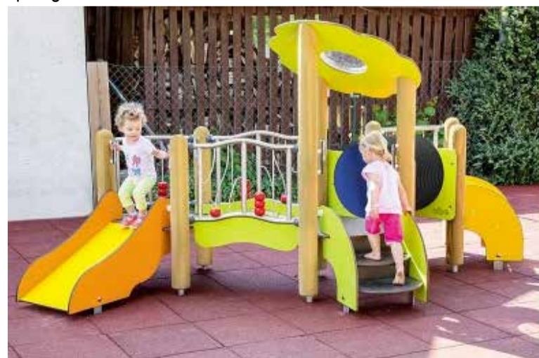
Speeltoestel Roos is gekozen door onze werkgroep.

Hopelijk kan de opening feestelijk met de buurt worden gevierd. Dit jaar bestaat de bewonersvereniging 30 jaar en kunnen festiviteiten eventueel worden gecombineerd ■