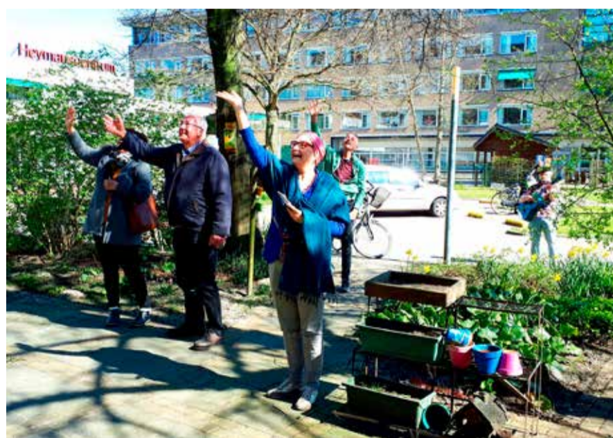
Dierbaar zwaaimoment tijdens een buitenoptreden

een verzetje en het contact met elkaar. Vanaf juni mag er ietsje meer en gaan we voor onze intramurale bewoners activiteiten organiseren in de binnentuin. Daar mogen wijkbewoners helaas nog niet komen maar we blijven ook optredens buiten organiseren op zondagmiddag.