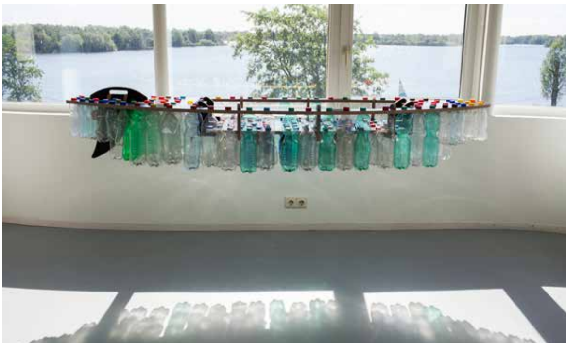
Boot van Maria Kojick

Het was de bedoeling de kunstmarkt, net als afgelopen jaar, te houden op het grasveld bij het Wall House aan de Lutulistraat. Intussen is Wall House#2 gelukkig in de weekenden wel weer open met de expositie "The Art of Waste". Net als vorig jaar zouden ook deze keer de kunstenaars hun werk vooral exposeren in tenten van 5 x 10 meter. Met mooi weer zou een aantal kunstenaars hun werk ook buiten kunnen uitstellen, maar garantie op mooi weer is er niet. In de tenten zou het onmogelijk zijn de anderhalve-metermaatregel te handhaven en tegelijk een gezellige markt te hebben. Ook op het terrein om de tenten zou het vermoedelijk lastig zijn alles conform de richtlijnen van het RIVM te laten verlopen. Daarom hebben we helaas deze beslissing moeten nemen. We hebben intussen de kunstenaars die zich al hadden opgegeven bericht. Volgend jaar hopen we u weer van harte welkom te kunnen heten. ■