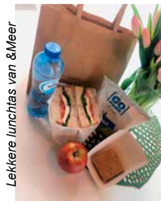
Lekkere lunchtas van &Meer

Ondanks de bijzondere COVID-19 periode hebben wij op 10 mei ons 1-jarig bestaan op gepaste manier gevierd. Wij zijn ervan overtuigd onze gasten nog veel langer te mogen bedienen.